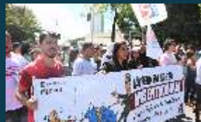
GREVE NACIONAL DA EDUCAÇÃO (2019)