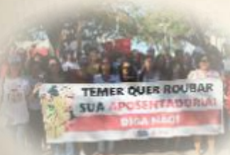
GREVE GERAL - 28 DE ABRIL DE 2017

O Sintietfal é um sindicato classista porque compreende que sua luta faz parte de uma luta mais geral e ampla de toda a classe trabalhadora para pôr fim a um sistema de exploração e dominação baseado no capital. Por isso, o Sintietfal participa e apoia movimentos que defendam os direitos, a justiça e a igualdade social.