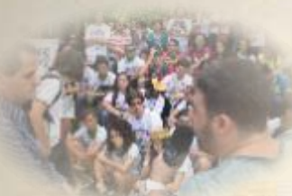
MOBILIZAÇÃO EM FRENTE À REITORIA (1/9/16)

Como profissionais da educação, lutamos por uma educação pública, gratuita e de qualidade para todos. O Sintietfal, como representante da categoria, não mede esforços para desenvolver essa luta com principalidade, reivindicando mais investimentos, contra a política de privatização e sucateamento e defendendo uma escola democrática.