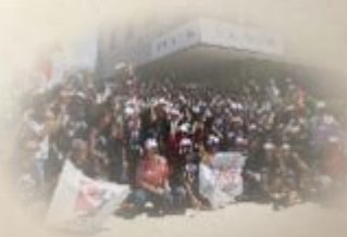
ATO CONTRA DEMISSÃO NO IFAL (2017)

Como representante legal e legítimo dos servidores e das servidoras do IFAL, o Sintietfal é o porta-voz das reivindicações coletivas e individuais da categoria. Ele fiscaliza e denuncia irregularidades, media conflitos com a Reitoria e combate o assédio moral no trabalho. O Sindicato é também o porta-voz da categoria no Conselho Superior.