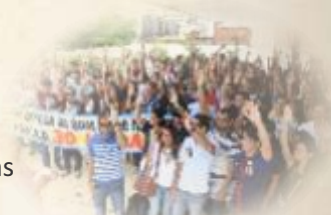
PARALISAÇÃO EM DEFESA DAS 30 HORAS

O serviço público é um dos principais alvos de destruição do governo, seja reduzindo orçamento, cortando verbas, vetando a expansão e novos concursos, criando PDV e interferindo na autonomia interna. Para os/as servidores/as do IFAL, isso também é sentido nas condições de trabalho e nos direitos que são atacados, como as 30 horas e a jornada docente. O Sintietfal está na linha de frente dessa luta, construindo mobilizações locais e nacionais.